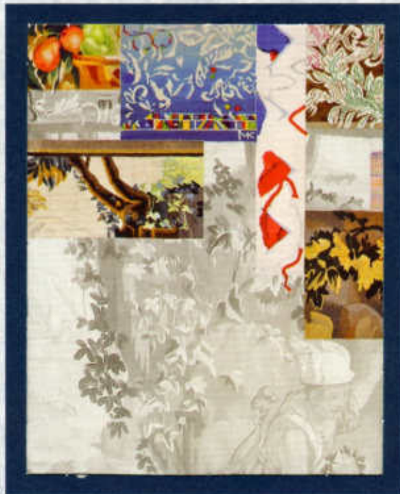
Európa szövete (részlet) / Web of Europe (detail) [2011]

ÖTVÖSSÉG FÉMMŰVESSÉG BELSŐÉPÍTÉS ZET DÍSZLET- ÉS JELMEZTERVEZÉS TEXTILMŰVÉS ZET GOBELIN BŐRMŰVESSÉG KERÁMIA PORCELÁN ÜVEG ALKALMAZOTT GRAFIKA IPARI FORMA TERVEZÉS MŰVÉS ZETELMÉLET RESTAURÁLÁS OKTATÁS MŰHELYEK GYŰJTEMÉ NYEK KIÁLLÍTÁSOK SZAKIRODALOM