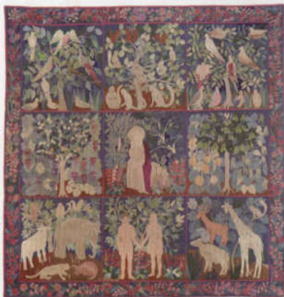
Ferenczy Noémi: Teremtés / Noémi Ferenczy: Creation [1913] Iparművészeti Múzeum, Budapest / Museum of Applied Arts, Budapest [223x219 cm]

Kiállítás az esztergomi Keresztény Múzeumban